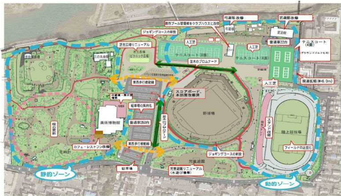
H27.12.22 豊橋公園整備計画図（案）

なお今回の事業提案の内容により、公園の整備計画を一部変更することを予定しています。