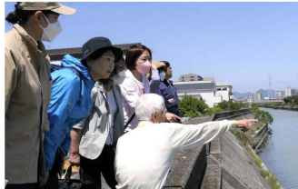
3日柳生川の堤防で住民の方と

6月2日午後から深夜にかけ、東三河一帯では、線状降水帯が発生するなど記録的な大雨に見舞われました。河川の氾濫、冠水による床上、床下浸水、農作物への被害など豊橋市の各地域で、深刻な被害状況が日々経つにつれ、明らかになってきています。